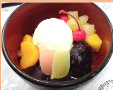
クリームあんみつ 600円 (税込)