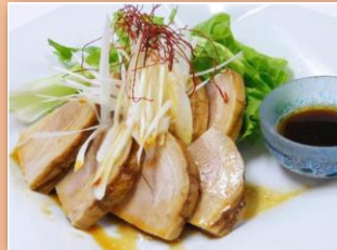
おつまみチャーシュー